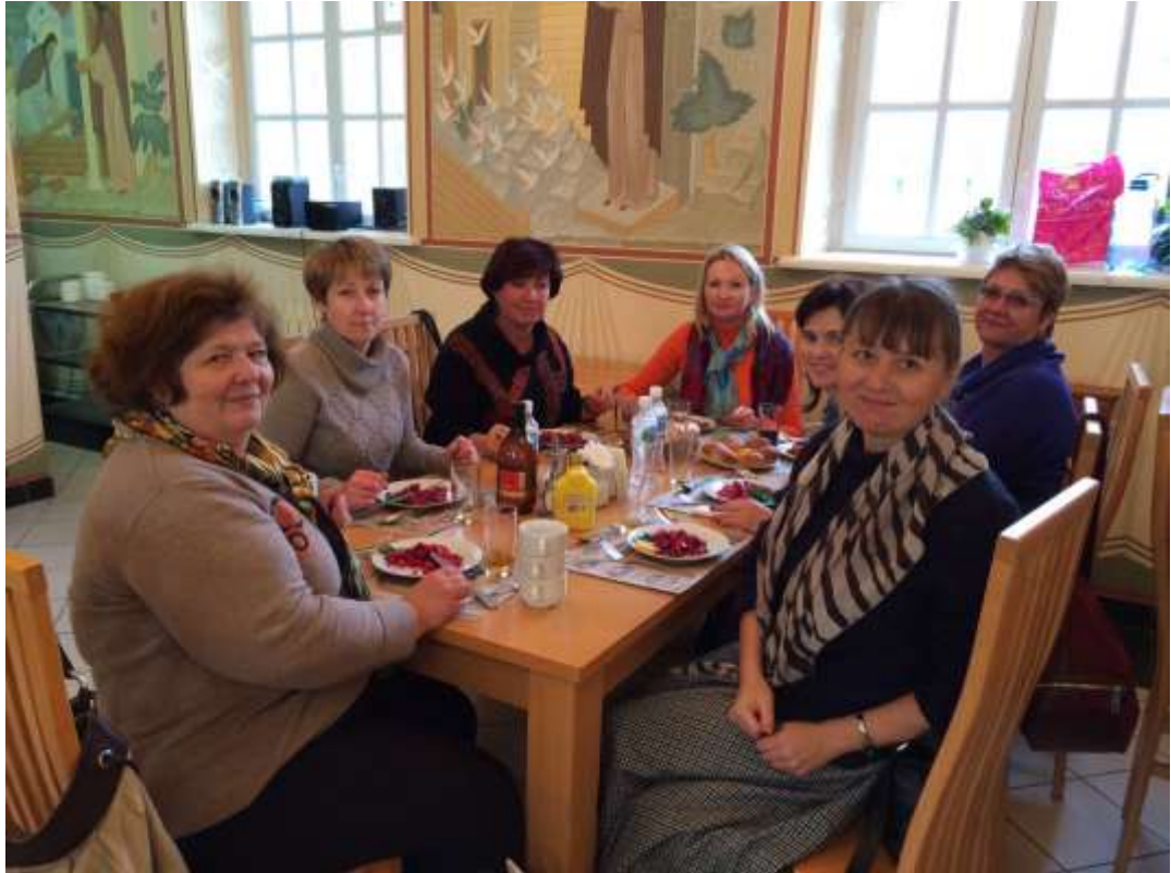
Очень вкусным был обед в Трапезной.